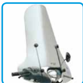
Øverst høyre: Vindskjermsett.