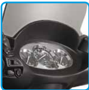
Øverst venstre: Stilren og lettlest tilbehør.

Piaggio X7 er en helt ny lettvektklasse scooter med høye kvalitetskrav til komfort, beskyttelse og stabilitet for føreren. X7 gir deg likevel en fullkommen kjøreopplevelse med sin avanserte teknologi, kraftfulle motor, lave vekt, store hjul og gode bremses. Det smidige designet og den solide konstruksjonen gir X7 et godt veigrep, høy grad av stabilitet og gjør scooteren velegnet i urbane miljøer. Gjennomtenkte detaljer og mye oppbevaringsplass gjør Piaggio X7 til et attraktivt førstevalg.