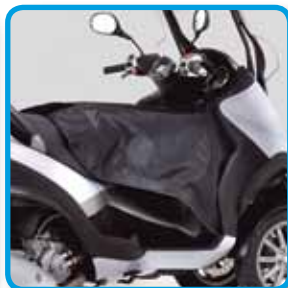
Øverst venstre: MC-trekk.