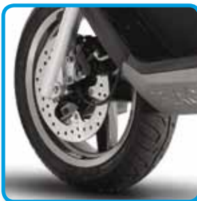
Øverst høyre: Kraftig skivebrems for god passiv sikkerhet.