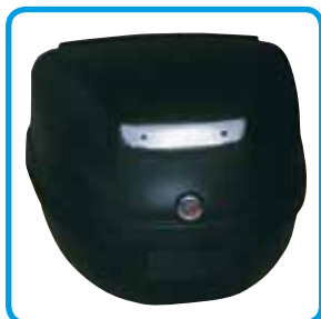
Øverst venstre: Praktisk toppboks.

Zip 50 er med sitt enkle rene design, praktiske løsninger og med den nye økonomiske 4-taktsmotor perfekt for raske og effektive turer i byen. Med sin beskjedne størrelse og store personlighet gjør den byen til et mer fargerikt og morsommere sted å være. Zip 50 kommer nå med en sporty og urban 2-takts motor som har et meget lavt bensinforbruk. Nye Zip 50 2 T er en svært økonomisk og miljøvennlig moped for deg som vil ha det enkelt.