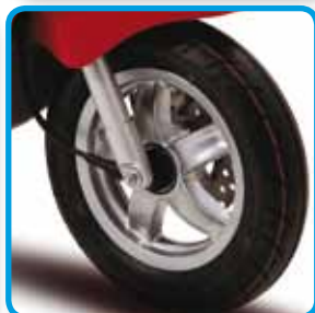
Nederst høyre: Skivebrems foran for god sikkerhet.