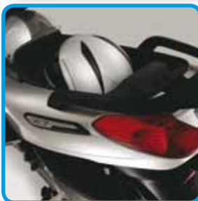
Nederst høyre: Praktisk oppbevaringsrom under sete.